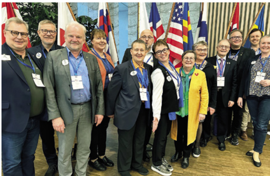
Suomen edustajia NSR-kokouksessa Kööpenhaminassa tammikuussa 2025.

– Nämä yhteiset tapahtumat ovat näyteikkunamme maailmalle, Rahko tuumaa.