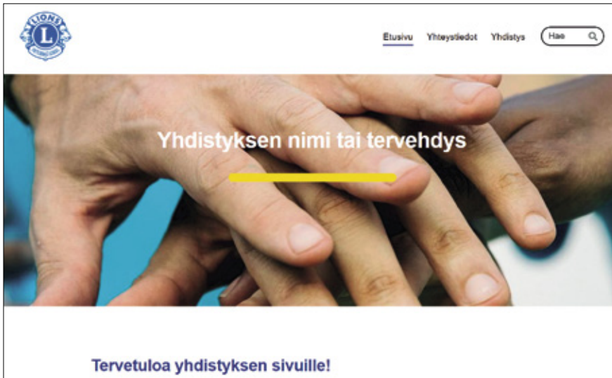
KUVA: KUVAKAAPPAAJUS SIVUSTOLTA

Lisäbuustia markkinointiin haimme vielä ensimmäistä kertaa myös Google Ads -haku-sanamainonnalla samanaikaisesti tammi-helmikuussa googlen hakutuloksissa. •