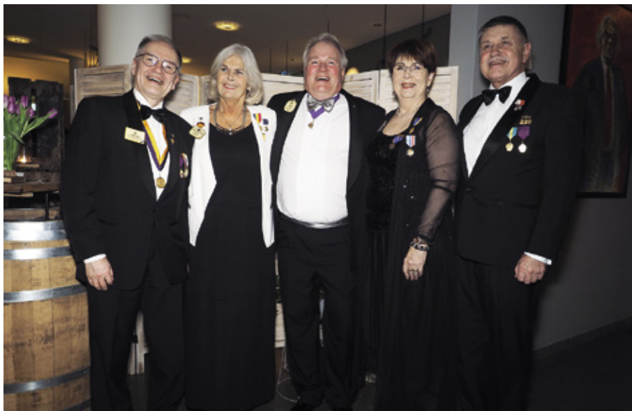
NSR:n työvaliokunnan jäsenet Ruotsin Norrtäljessä tammikuussa 2018.

Pohjoismaiden lionit esiintyvät yhteisenä ryhmänä vuosittain Lions-järjestön kansainvälisessä vuosikokouksessa.