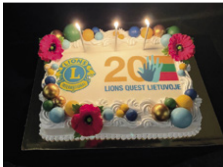
Lions Quest -toimintaa on ollut Liettuassa jo 20 vuotta.

Vuoden 2000 jälkeen digitaaliset palvelut ovat saaneet sijaa ja teknologia on kehittynyt kiihtyvällä vauhdilla. Kestävän kehityksen näkökulma on noussut merkitykselliseksi. Ihmiskeskeisille palveluille on tilausta ja yhteisöllisyyden vahvistaminen on erityisen tärkeää. Leijonien palvelussa fyysisen avun rinnalla myös ihmisten vahvistaminen on saanut merkitystä.