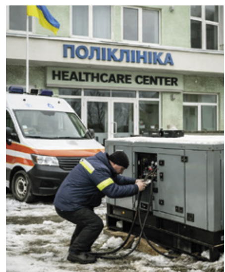
WICTU 4 -hanke toimittaa elintärkeää energiaa sinne, missä sitä eniten tarvitaan.

Olemme jo auttaneet yli puolta miljoonaa ihmistä aiemmissa WICTU-hankkeissa,