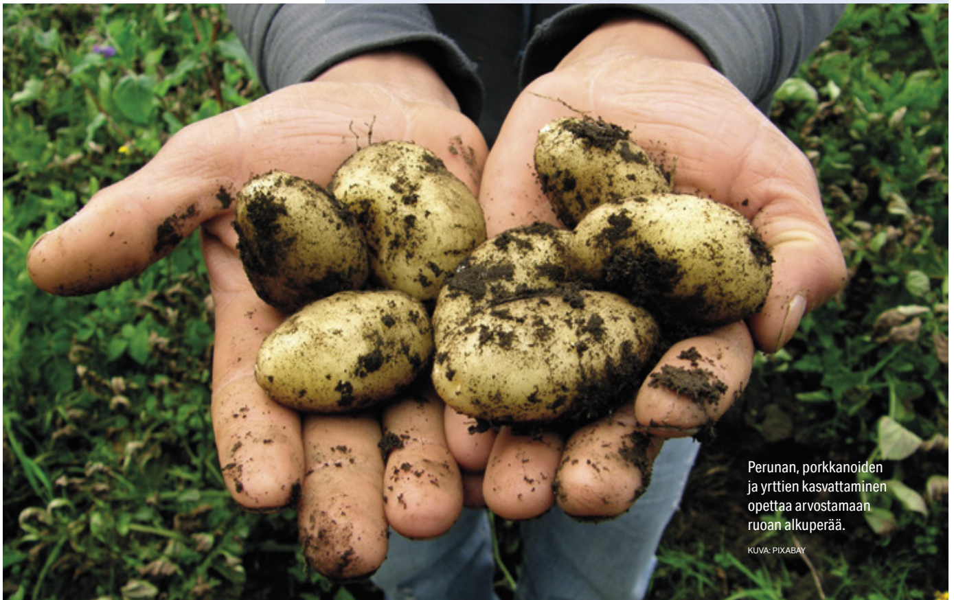
Perunan, porkkanoiden ja yrttien kasvattaminen opettaa arvostamaan ruoan alkuperää.

Klubit voivat rakentaa hyönteishotelleja ja vaikkapa perustaa kukkaniittyjä joutomaille. Nämä teot turvaavat suoraan lähialueen marjojen, omenoiden ja viljelykasvien pölytyksen, mikä lisää alueen omaa ruokatarjontaa.