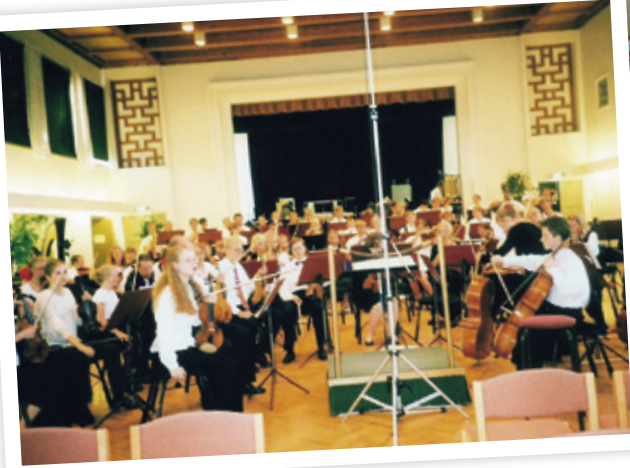
Orkesteri Norden 1994 Ingesundin Musiikkikorkeakoulun salissa Arvikassa.

Suomalainen lionstoiminta täyttää tällä kaudella 75 vuotta. Juttusarjassa kurkataan menneisiin vuosiin.