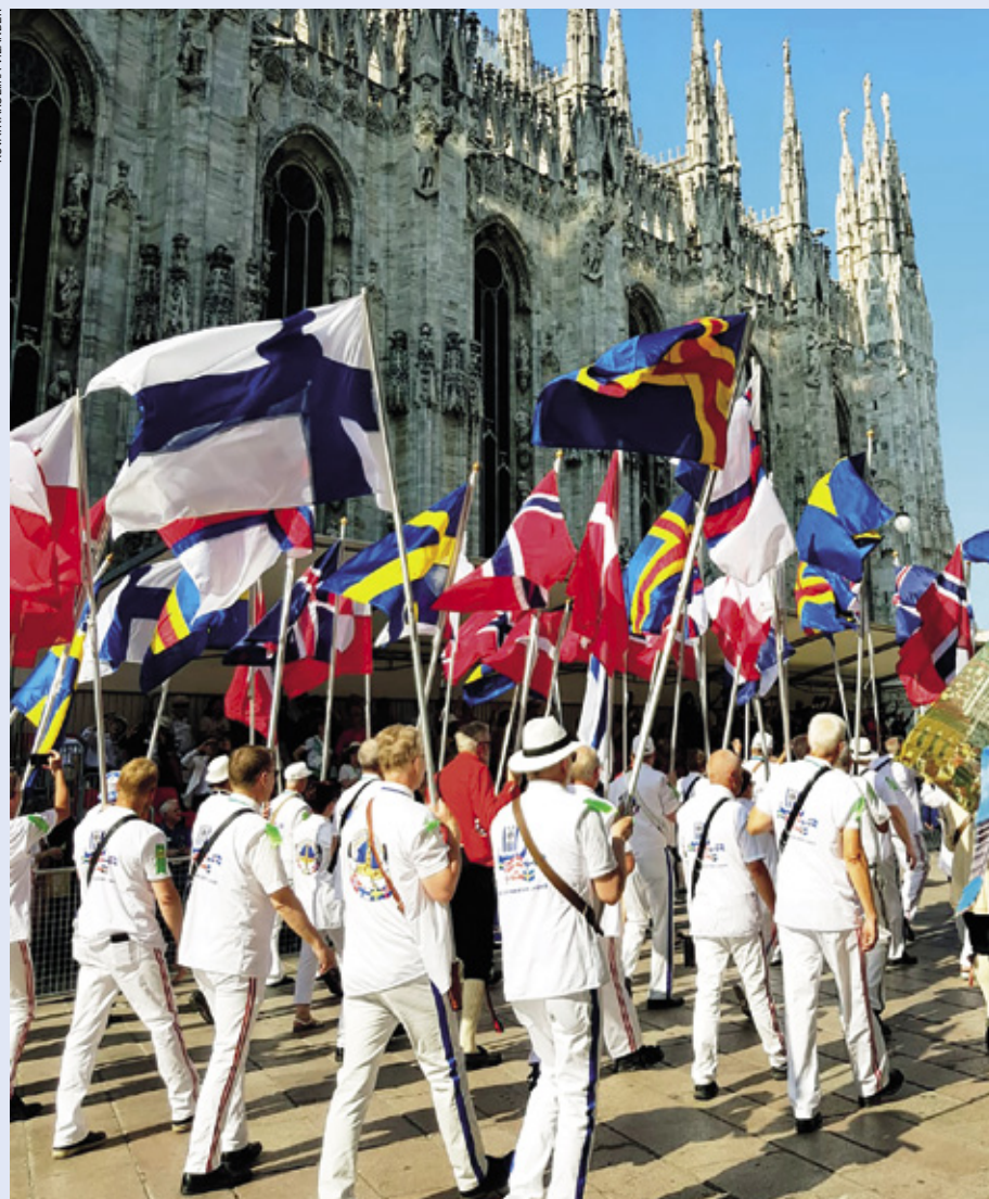
Suomalainen kansainvälinen johtaja edustaa kansainvälisessä hallituksessa Suomen lisäksi Pohjoismaita. Pohjoismaiset liput liehuivat Milanossa vuonna 2019 kansainvälisen vuosikokouksen kansakuntien paraatissa Pohjoismaiden yhteisessä paraatiryhmässä.

Odotetaan, että ehdokkaalla on kokemusta myös kansainvälisistä lions-tehtävistä ja hänellä on hyvä englannin kielen taito. Kielitaidon lisäksi tarvitaan myös muita hyviä viestintätaitoja, kuten hyvä esiintymistaito, hyvät sosiaaliset taidot ja konfliktinratkaisutaidot. Tässä kohdassa ajattelen, että suomalainen ID voi hyvällä toiminnallaan ja käyttäytymisellään edistää myös Suomen lionien hankkeita. Tuloksekkaassa hallitustyöskentelyssä ja toimikunnissa tarvitaan myös innovatiivisuutta sekä kykyä strategiseen ajatteluun. >>>