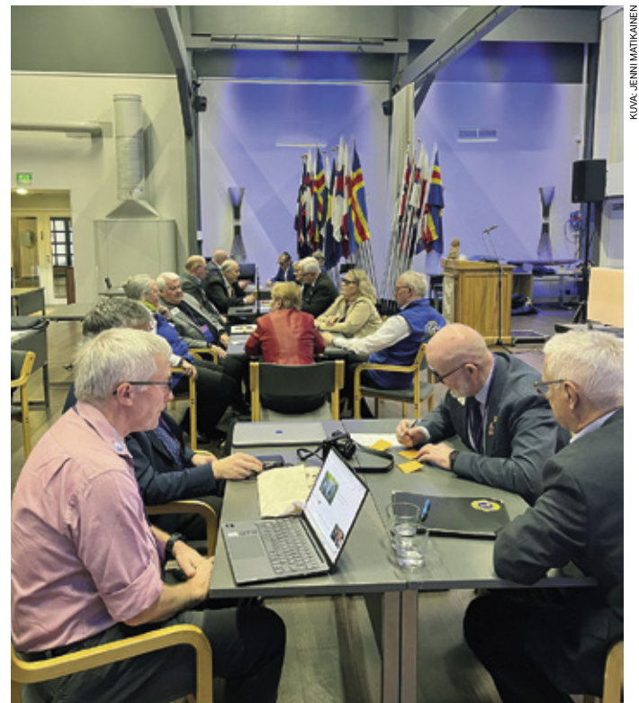
Kaikki osallistujat pääsivät mukaan yhteiseen työskentelyyn.