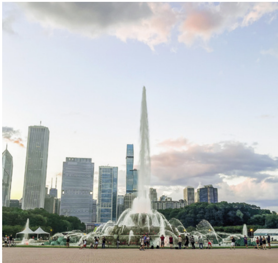
Retket Chicagoon, museovierailut ja paikalliset tapahtumat avasivat näkymiä amerikkalaiseen kulttuuriin.

Vierailu amissikylässä oli ikimuistoinen kokemus, joka toi näkymän täysin erilaiseen elämäntapaan. Toisaalta arjen pienet hetket – valokuvien kehittäminen koululla, autotallimyyntinä auttaminen ja yhteiset illat isäntäperheen kanssa – syvensivät ymmärrystäni paikallisesta elämästä.