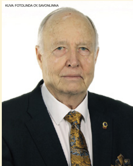
IPDG ARI ORA