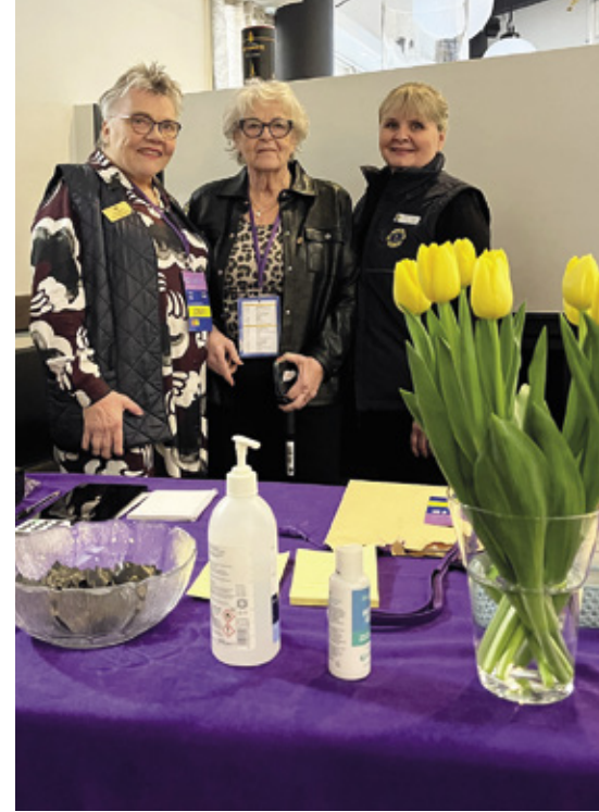
Ilmoittautumisen vapaaehtoiset lionit innostuivat tapahtumasta niin, että ryhtyivät jo suunnittelemaan matkaa NSR2027:ään Islantiin.