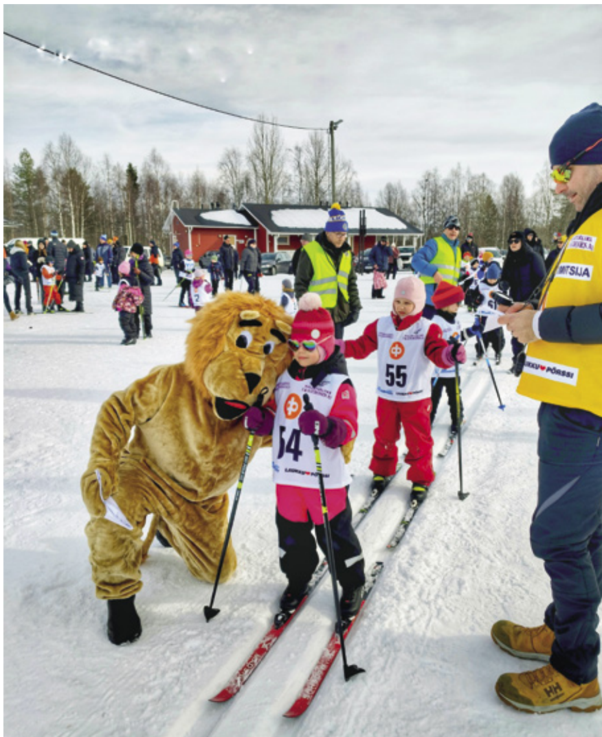
LC Kemina järjesti 28.3. Kallinkankaan hiihtokeskuksessa Lasten Leijonahiihtotapahtuman. Näissä kisoissa kaikki hiihtäjät pääsevät mitaleille. Kuvassa edellisen vuoden tunnelmia.