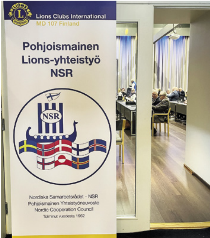
Tuusulan Krapissa toivotettiin osallistujat tervetulleiksi Suomeen.