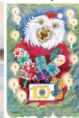
100-VUOTIAAN LEIJONAN JOULU