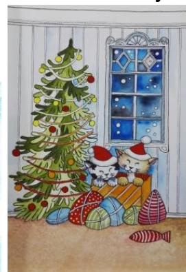
JOULUN ILOISIA YLLÄTYKSIÄ