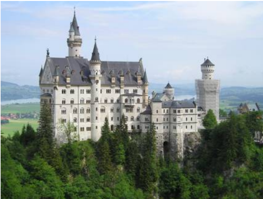
Neuschwansteinin linna Etelä-Saksassa. Linna ei koskaan valmistunut kokonaan korkeiden kustannusten takia.