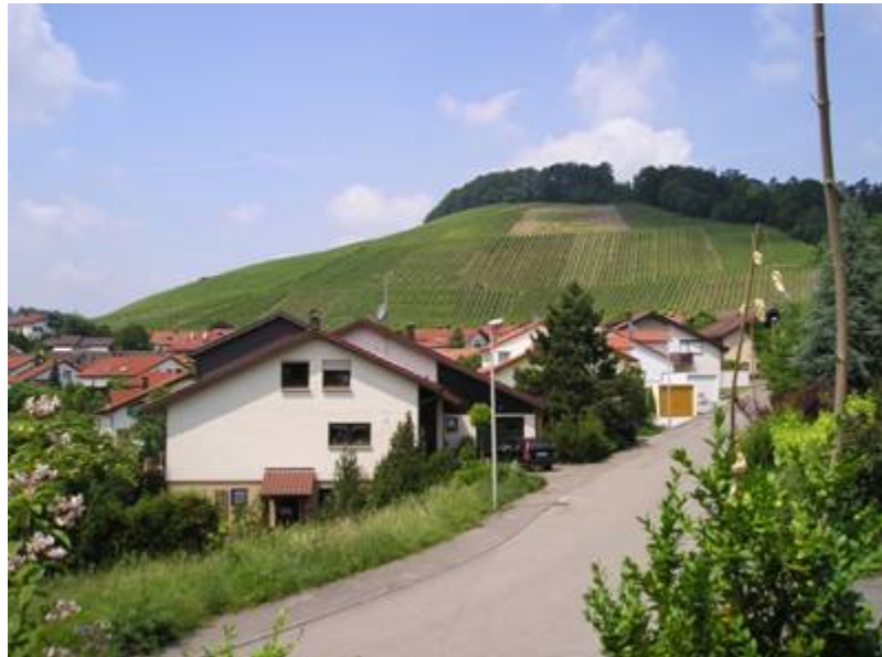
Näkymä isäntäperheen talon terassilta viiniköynnösten peittämälle kukkulalle.

beilsteinilaisten nuorten ajatusmaailmat tai elämä yleensäkin eroa paljoakaan. Nuoriso olikin yksi yleismaailmallisista "ilmiöistä", jotka muistuttivat ihmisten olevan suunnilleen samanlaisia joka puolella. Erojakin tosin oli: en olisi voinut kuvitellakaan suomalaisten nuorten väittelevän politiikasta iltaa viettäessä, mutta Saksassa sekin onnistui.