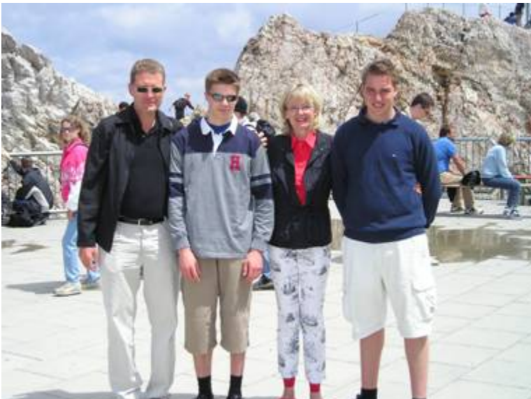
Isäntäperhe Gaul sekä minä (toinen vas.) Zugspitzellä hieman vajaan 3000 metrissä.

Perheestä oli nopeasti havaittavissa selvä arvojärjestys: isä oli selvä johtaja; hän esimerkiksi istui aina ruokaillessa pöydän päässä, äiti oli isästä seuraavana ja lapset viimeisinä.