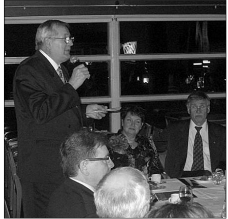
Perti V. tarinoi klubin vaiheista perustajaveljen näkökulmasta.