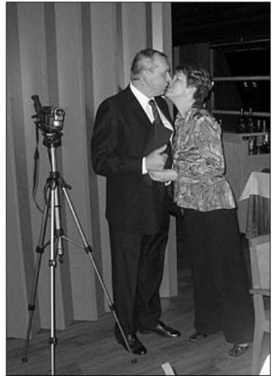
Jote sai erikoiskohtelun paikan päällä, tällä kertaa ilmeisestikään ei pelkästään sen takia, että hän kuvasi juhlan kuvat.