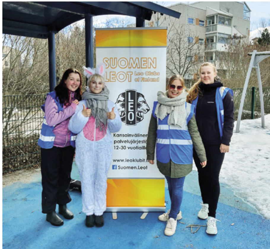
Järvenpään klubilaiset saivat jälleen järjestettyä perinteeksi muodostuneen tapahtuman.