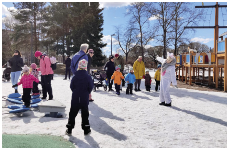
Pääsiäispupu piti jumppahetken lapsille.

Suklaamunia etsittiin kolmessa eri ikäryhmässä, jotta kaikille oli ikätasoon nähden sopivia pii- loja. Pääsiäispupukin vieraili tapahtumassa ja piti lapsille jumppahetken! Lapset lähtivät hymyissä suin pääsiäismunien kanssa kotiin.●