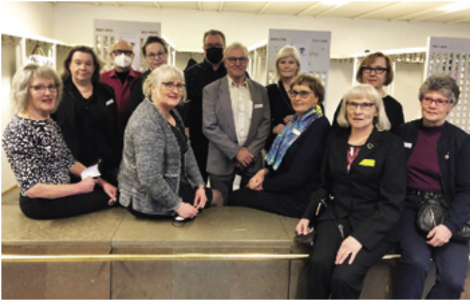
Joensuussa pidetyn konsertin naukakosta, järjestyksen valvonnasta ja lipun-tarkastuksesta saadut varat luovutettiin kokonaisuudessaan Ukraina-keräykseen.