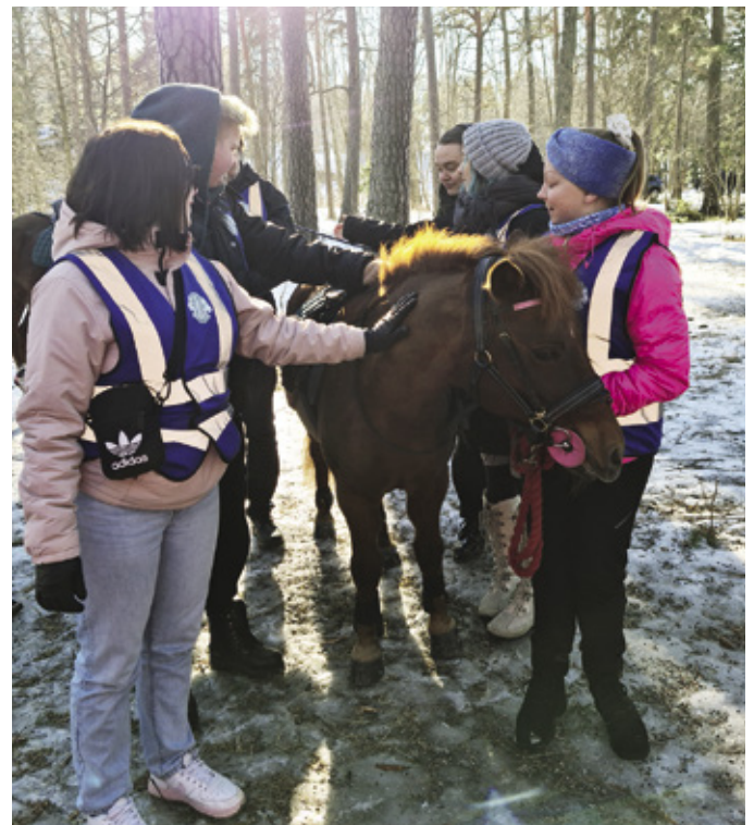
Klubilaiset auttoivat talutusratsastuksessa, ja lopuksi oli tietysti päästävä rapsuttelemaan poneja itsekkin.