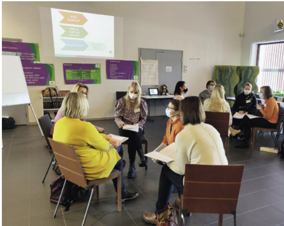
Jokaisen kurssin päätteeksi tiedustelimme osallistujilta palautetta koulutuksista. Kaikkien koulutusten yleisarvosanaksi saimme tällä kaudella 4,5 asteikolla 1–5.