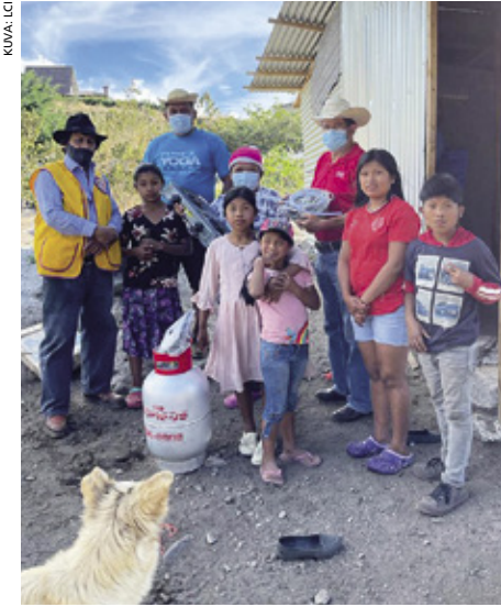
Lionit toivat apua myrskyn uhreille Costa Ricassa, Panamassa, Guatemalassa ja Hondurasissa.