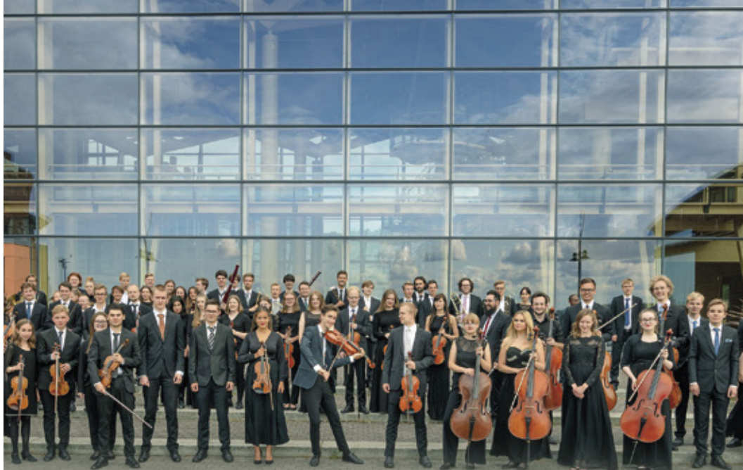
Orkester Norden samlades innan coronapandemin förra gången i Lahtis år 2019.

Ungdomsutbytet består av internationella läger och familjevistelser för ungdomar i åldern 17–21 år. Lägren ordnas i regel under sommaren och är ett par veckor långa. Ungdomsutbytet är en klubbaktivitet och klubbarna brukar vanligtvis stöda "sina" ungdomars resor med ett separat överenskommet belopp.