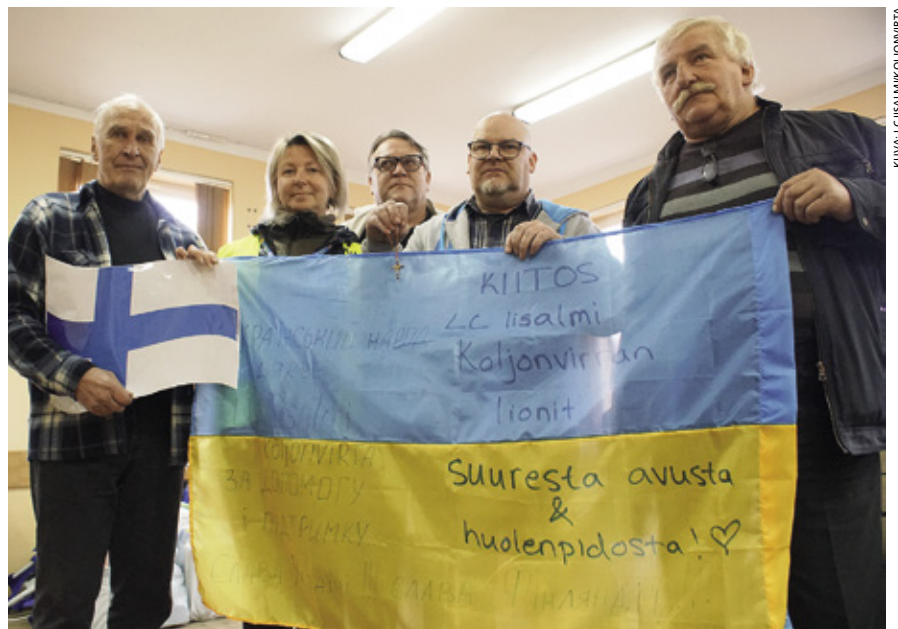
Ukrainalaiset halusivat välttämättä lahjoittaa kiitokseksi maansa lipun. Tilaisuuden kruunasi ukrainalaisittain valmistettu borssikeitto, jonka saimme nauttia.

Lankalauantaina olimme pienessä kylässä Jaroslawin kaupungin lähellä. Lahjoitustavarat tyhjennettiin kylätalon suureen saliin. Kuulimme, että mahdollisesti vielä samana iltana ne jatkavat matkaa Ukrainaan. Suurin osa vaipoista menee rintamalla, sotilaiden kengänpohjallisiksi. >>>