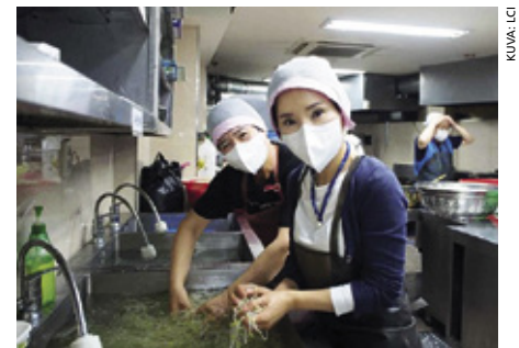
Seoullissa valmistettiin yli 500 ateriana ja vietiin tarpeessa oleville.

Kun lionit saivat kuulla kriisistä, he ryhtyivät toimeen. He saivat LCIF:ltä 7058 USD apurahaa, joka on tarkoitettu tukemaan piirin ja klubin työtä paikkakunnalla. Yhteistyössä paikallisten järjestöjen ja sponsorien kanssa he saivat kerätyksi ruokatavaroita 500 ateriana varten. Ateriat valmistettiin ja vietiin tarpeessa oleville.