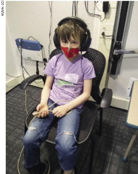
Lionit hankkivat kuuloklinikalle LCIF:n myöntämällä apurahalla yhden uuden äänierion ja siihen liittyvää laitteistoa.

– Teknologia antaa meidän tehdä arvioita murto-osassa siitä ajasta, joka meni vanhan teknologian kanssa, sanoo eräs LCHC:n kuulontutkijoista.