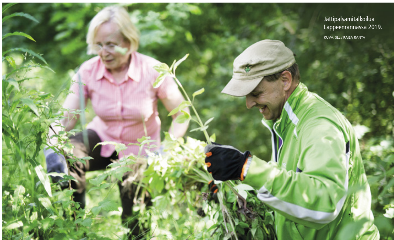
Jättipalsamitalkoilua Lappeenrannassa 2019.

Aktiivista kesää ympäristötalkoiden parissa!•