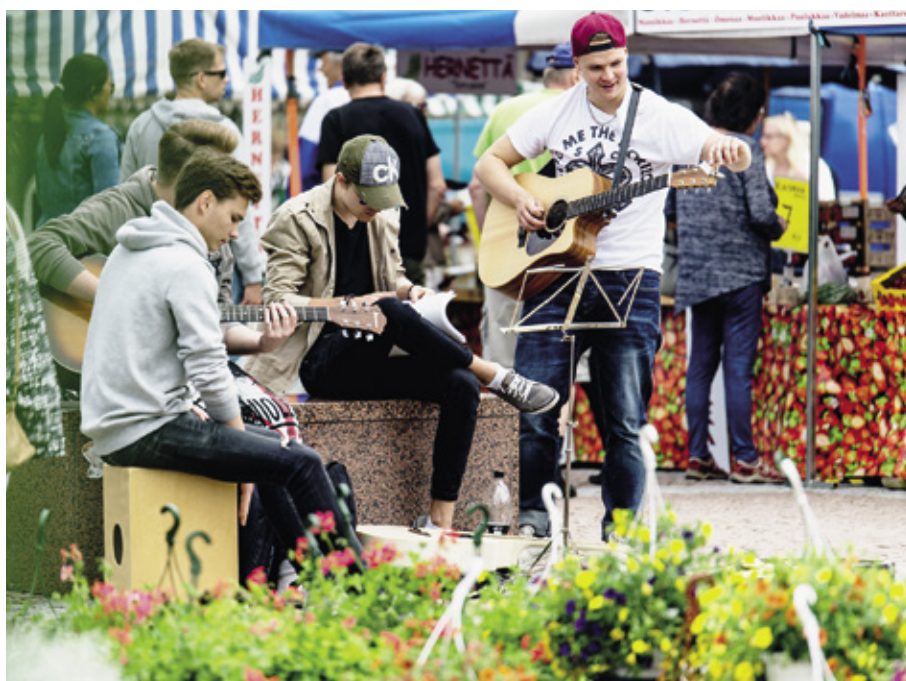
Oheisohjelmat vievät eri puolille Kouvolaan.

Repoveden kansallispuisto tarjoaa retkeilijälle useita eritasoisia reittejä noin 50 kilometrin päässä Kouvolaan. Reittivaihtoehtoja löytyy sekä vaeltajille, pyöräilijöille että melojille. Jos sinulla on käytössäsi oma auto, Repovedeltä löytyy paikoitusalueita vaellus-